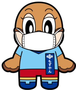
ちやくよう マスク着用