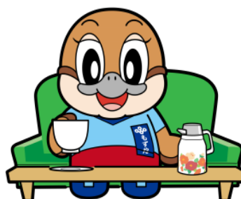
ふようふきゅう がいいつじしゆく 不要不急の外出自粛